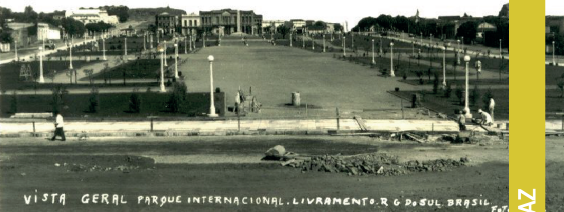
Plaza Internacional - en construcción (1942)

Fundadas como asentamientos de posicionamiento limítrofe entre Uruguay y Brasil, acompañando una lógica de reforzamiento de la frontera entre los jóvenes estados, las ciudades de Rivera y Santana do Livramento se han desarrollado constituyendo lazos de unidad en el marco de una actitud integradora de sus habitantes. En este sentido, parecería más apropiado citar las motivaciones de ocupación de aquellos parajes que precedieron a las preocupaciones por los límites de las distantes capitales. Un paso favorable en la ruta del ganado entre ambos países, es más consecuente con esta realidad que trasciende la buena vecindad. Es así, que la denominación “Frontera de la Paz” es incorporada por sus habitantes a modo de manifiesto de la fraternidad que las une.