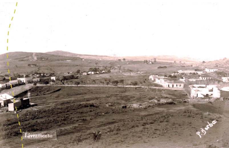
Rivera-Livramento (1892)

Aunque el nombre era el mismo, no se refería al mismo personaje histórico, pues mientras la Villa refiere al Coronel Bernabé Rivera, el departamento lo hace al General Fructuoso Rivera.