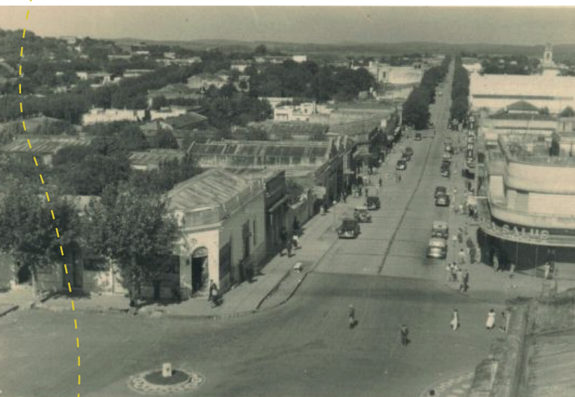
Av. Sarandí esq. Orientales, ciudad de Rivera (1950)