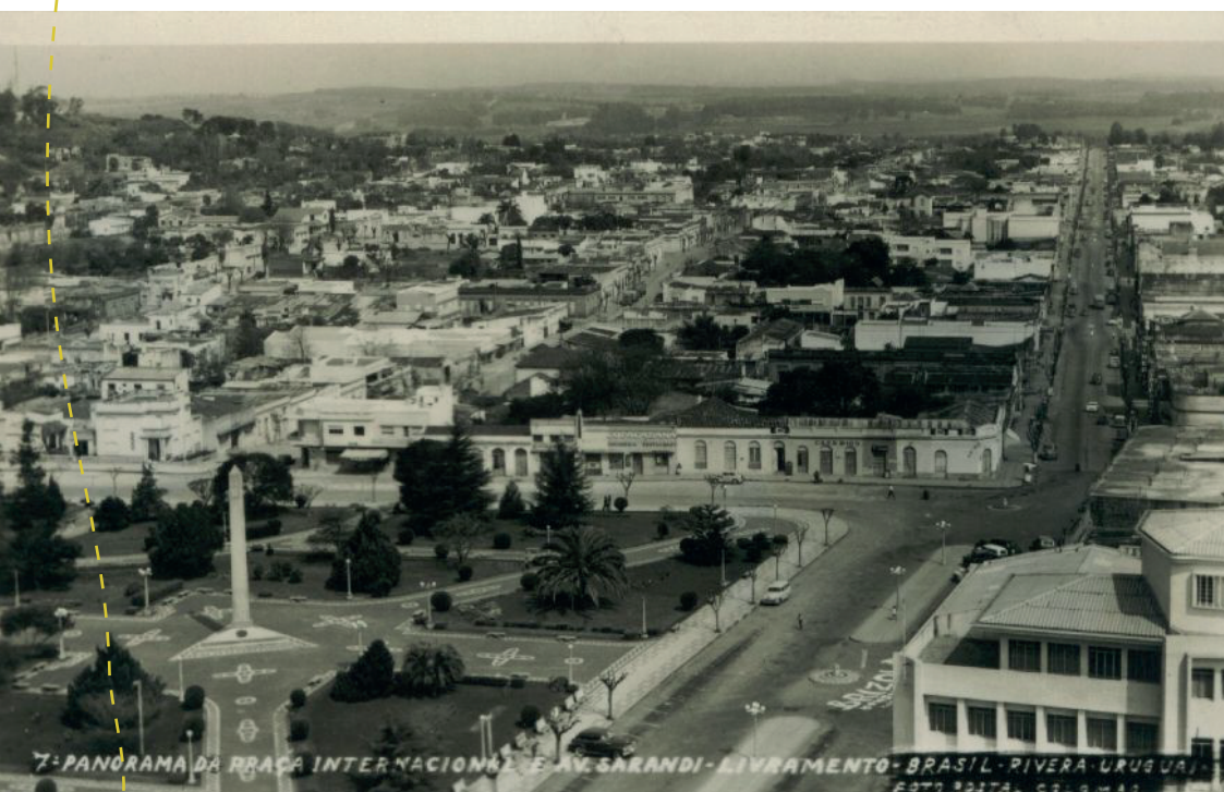
Foto aérea de la ciudad de Rivera, Año 1950.