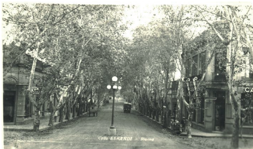
Alumbrado público en Ceballos esq. Sarandí

En 1930 se instala el primer alumbrado público con lámparas incandescentes en la calle Cuaró. Para su época innovadores y costosos, los artefactos fueron distribuidos solamente en las esquinas.