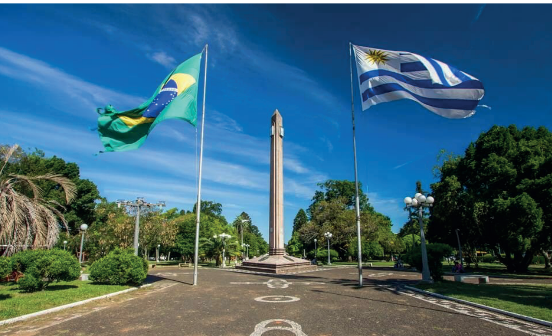
Obelisco de la Plaza Internacional

En síntesis, la retroalimentación cultural entre ciudad de Rivera y Santana do Livramento se da en diversos aspectos de la vida cotidiana, y ha generado una cultura regional con una identidad única que refleja la rica historia y diversidad.